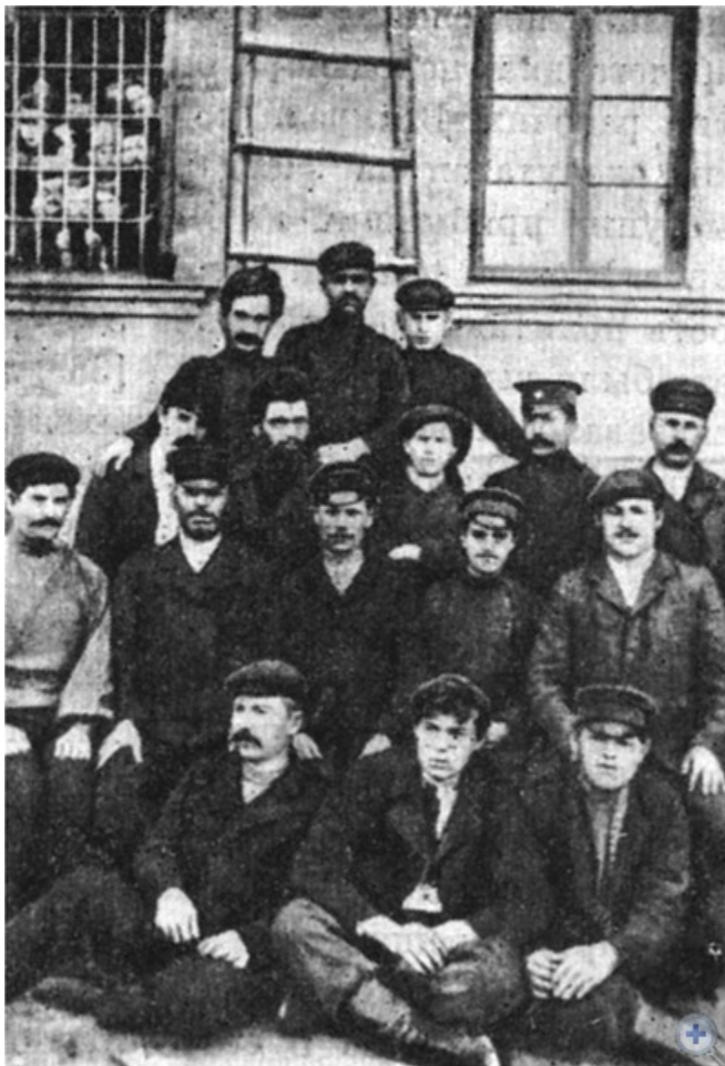
Группа заключенных — участников революционных выступлений в Вознесенске. Фото 1905 г.

оживилась экономическая жизнь города. Сюда прибыло много рабочих — строителей, железнодорожников. Были сооружены железнодорожная станция, паровозное депо, товарные, а на северной окраине — большие артиллерийские