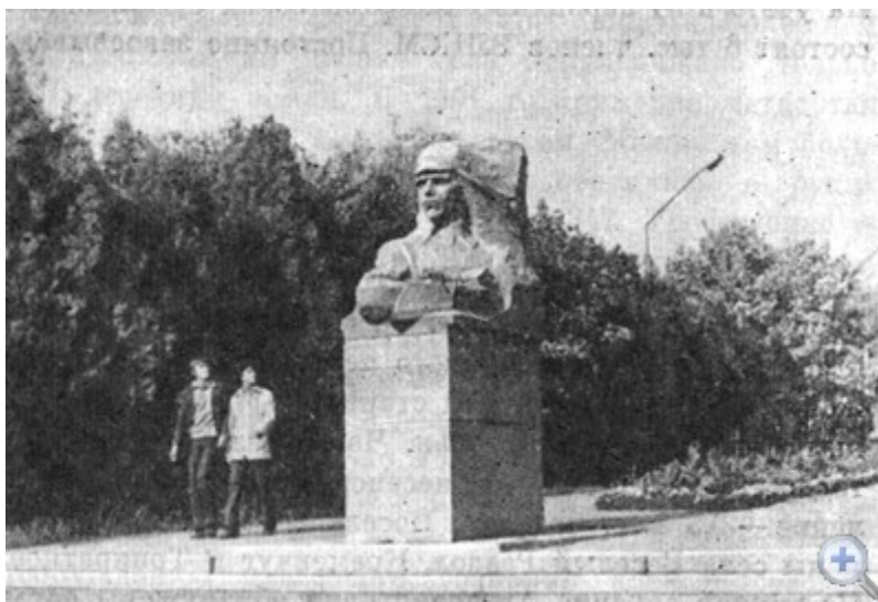
Памятник Н. А. Островскому в Вознесенске. 1980 Г.

Хозяйственные, социально-экономические и общественно-политические задачи вознесенцы решают под руководством партийной организации города, насчитываю-